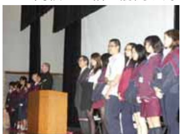
ウィレトン高校歓迎会

オーストラリア・ウィレトン高校への語学研修、韓国馬山合浦高校やタイ王国トリアムウドムスクサ高校との相互訪問や海外研修旅行を通して国際的視野を広めています。