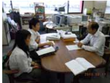
S C P 営業活動