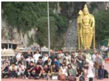
ヒンズー教の聖地バツ洞窟