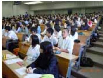
経済学部産学連携講義