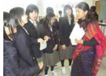
各クラスでの文化交流 2