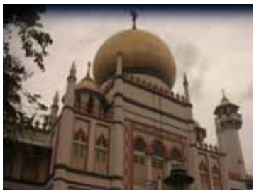
アラブストリート