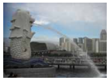
マーライオンパーク