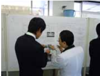
類型生徒課題研究発表会 1