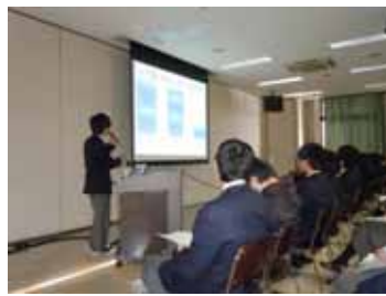
類型生徒課題研究発表会 2