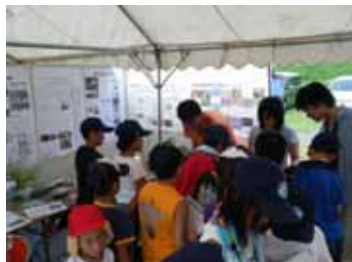
揖保川での川の学校