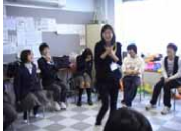
各クラスでの文化交流会 1