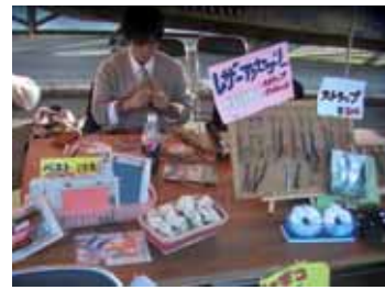
S C P 販売風景