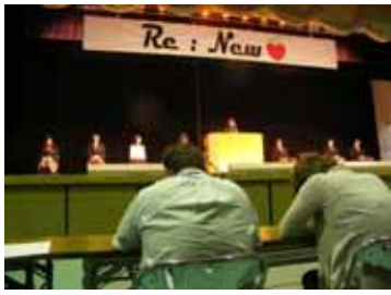
スピーチコンテスト