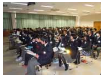
類型生徒課題研究発表会 3