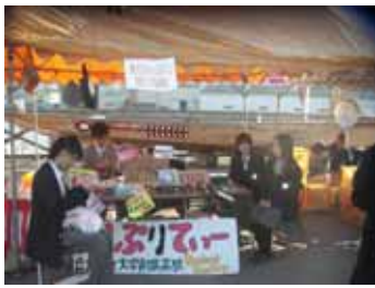
類型特別授業（スクールカンパニープログラム）