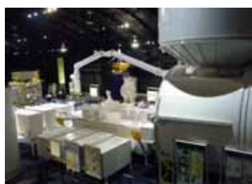
宇宙航空開発機構筑波宇宙センター

筑波・東京研修や西はりま天文台研修等の校外施設での研修を充実・発展させ最新の科学技術に触れることにより将来の科学者としての精神を育てています。