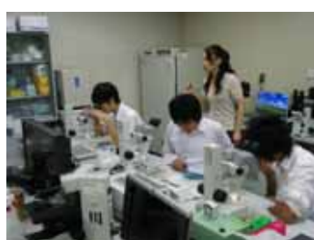
筑波大学遺伝子組換え生物の観察