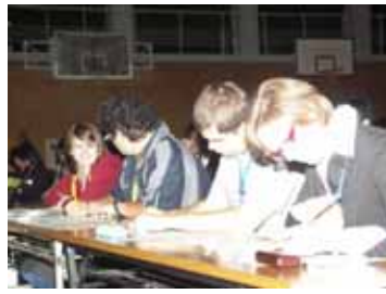
スピーチコンテスト審査風景