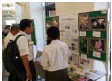
日本生物教育会全国大会