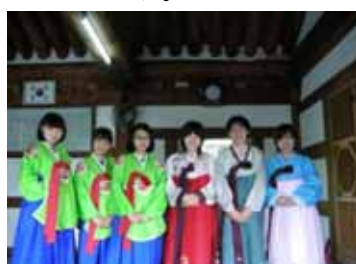
韓国馬山合浦高校訪問