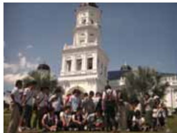
ジョホール・バル