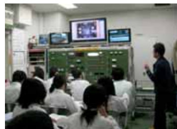
近畿大学原子炉研修